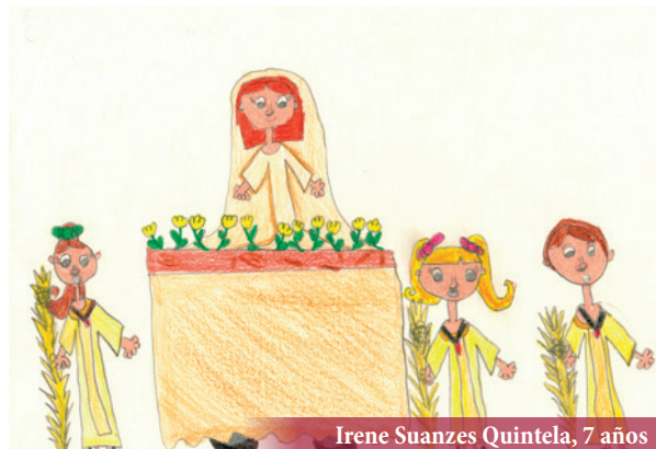
Irene Suanzes Quintela, 7 años